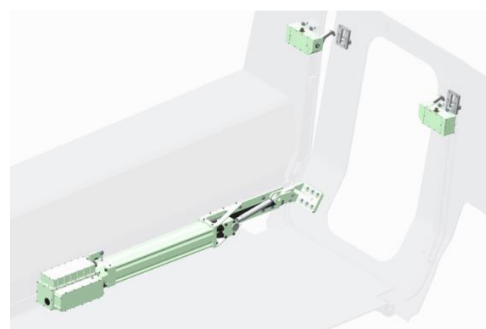
Motorisation de rampe arrière pour véhicule blindé