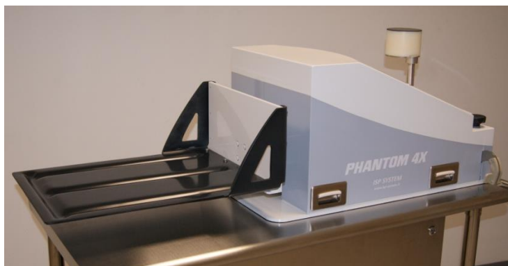
Non contractual photo

Ce dispositif permet de déplacer un fantôme pour dispositifs d'imagerie suivant une trajectoire 3D paramétrable