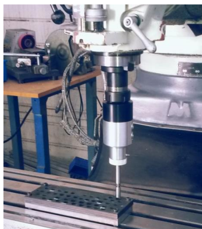
Contrôle dimensionnel à 100% de plusieurs alésages sur une plaque